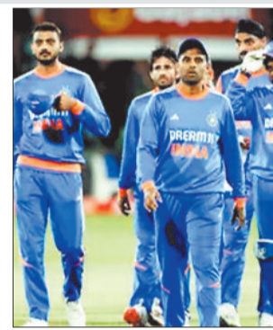
चौथा दौरा होगा। टीम इंडिया 2018, 2022 और 2023 में भी आयरलैंड के दौरे पर गई थी। वहीं, भारतीय

बीसीसीआई की ओर से जारी शेड्यूल के मुताबिक, भारतीय टीम 26 जून और 28 जून को पहला और दूसरा टी20 मुकाबला खेलेगी। दोनों मुकाबले बेलफास्ट में खेले जाएंगे। भारतीय क्रिकेट टीम का हाल के कुछ वर्षों में आयरलैंड का यह